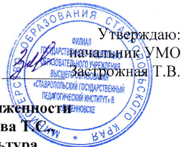
График ликвидации академической задолженности студента 3 курса группы 3 Г Аскерханова Т.С. специальности: 49.02.01 Физическая культура